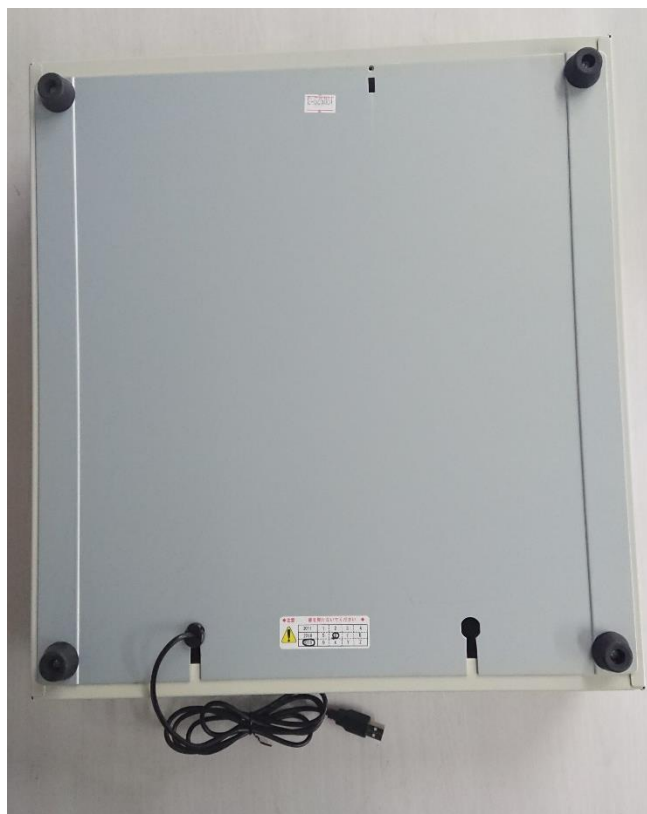
従来品 (423 サイズ)