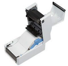
カバーオープン時