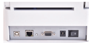
マルチインターフェース