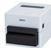
オートカッターモデル