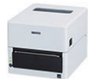
感熱モデル(カッターありなし)